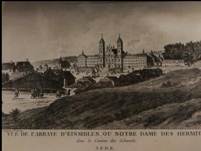
Abbaye de Einsiedeln

On connaît la dévotion des enfants de St Benoît pour la Vierge.